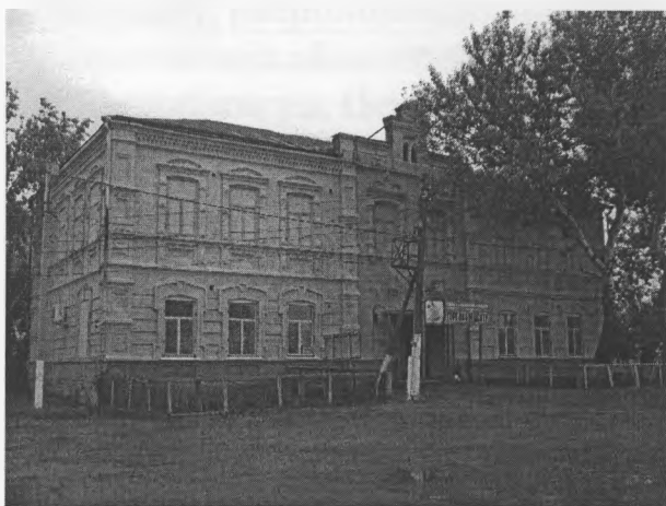
Здание Земской школы. 15.05.2017 г.

Саратовская область, Энгельский район, с. Терновка, ул. Центральная, 43